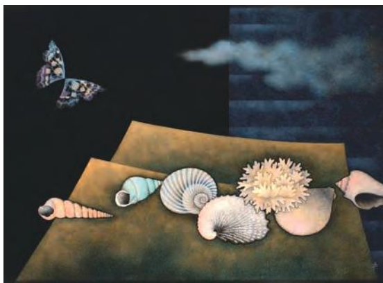
三谷吾一《潮風》 日本芸術院蔵