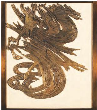
蓮田修吾郎《森の鳴動》 日本芸術院蔵