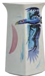
武腰敬昭《無鉛釉 空の王者》 能美市九谷焼美術館五彩館蔵