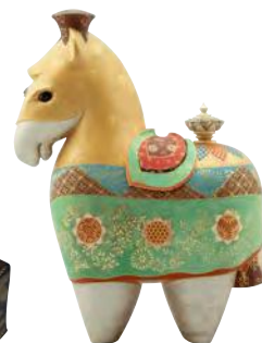
西出大三《木彫鍍金彩色「飾馬」》 石川県立美術館蔵