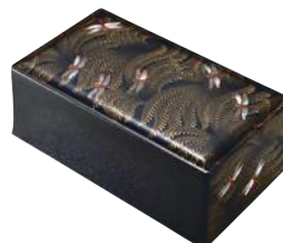
松田権六《赤とんぼ蒔絵飾箱》 京都国立近代美術館蔵