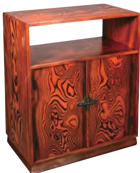
水見晃堂《唐松造砂磨棚》 石川県立美術館蔵